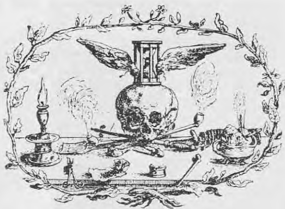
Hec vite imago. fumus, atq; herbe vapores Humana cuncta: et, verbo ut absolvam, nihil.

Het sap dat getrokken kan worden van tabaksbladeren wordt hierin beschreven als een soort wondermiddel tegen allerlei kwalen, "om te genesen alle oude kankeragtige ende voortetende seren, meelagtige schorftheyd, vochtige tranende seren, hoe quaed die ook mogen wesen; ook alle klieren, kropsweren, aposteunien ende swellingen, stotingen, blutzingen ofte andere quetzuren der leden, de fijs, roodheyd ende peukelen des aensichts, ende veel meer andere gebreken" 3 . Onder het 'misbruik van den taback' verstaat Scriverius het roken voor het genot.