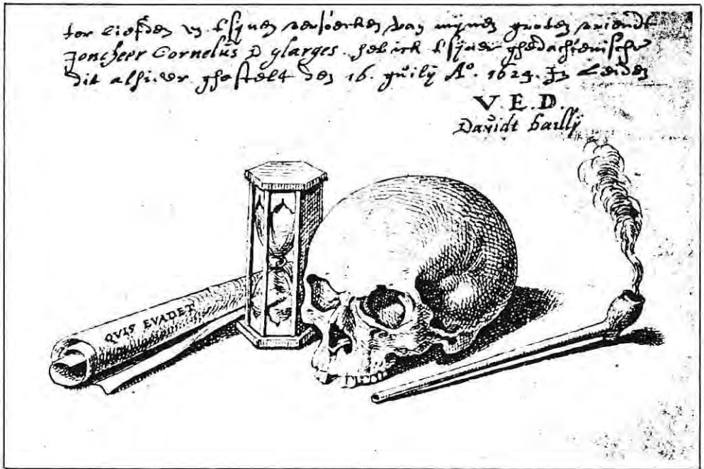
Afb. III. Pentekening, David Bailly (1624)

Geheel in overeenstemming met de praktijk van vaagheid en meervoudige betekenissen, is ook de pijp een meervoudig uitlegbaar en gecompliceerd symbool in de schilderkunst. In de meest indirecte zin vormt de pijp een symbool voor de vergankelijkheid van het menselijk leven. De pijp gaat dan vergezeld van voorwerpen die eenzelfde betekenis hebben: schedels, uurwerken, uitdovende kaarsen, boeken, omgevallen roemers (afb.I). Bron voor deze interpretatie is een bijbel-passage waarin rook als symbool voor de korthed van het leven wordt gebruikt, "Het leven is maar ijdele rook". Een Vanitas-stilleven van David Bailly uit 1624 geeft uitdrukking aan deze gedachte (afb.III).