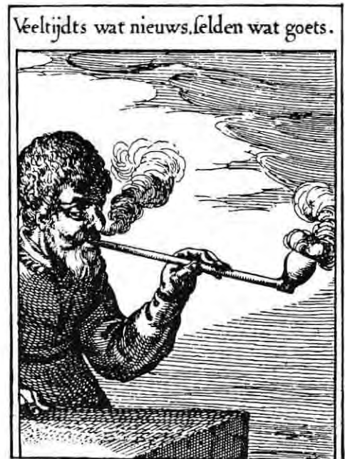
Afb.II. Uit Roemers Visscher's Sinne-poppen (1614)

In de emblemata werd vaak een opzettelijke vaagheid en dubbelzinnigheid aangebracht. Men wilde de beschouwer zo aansporen tot nadenken, tot bezinning. De aldus aangebrachte meervoudige betekenissen maken het de huidige beschouwer wel moeilijk, doch niet onmogelijk om de preciese betekenis van bepaalde symbolen te achterhalen.