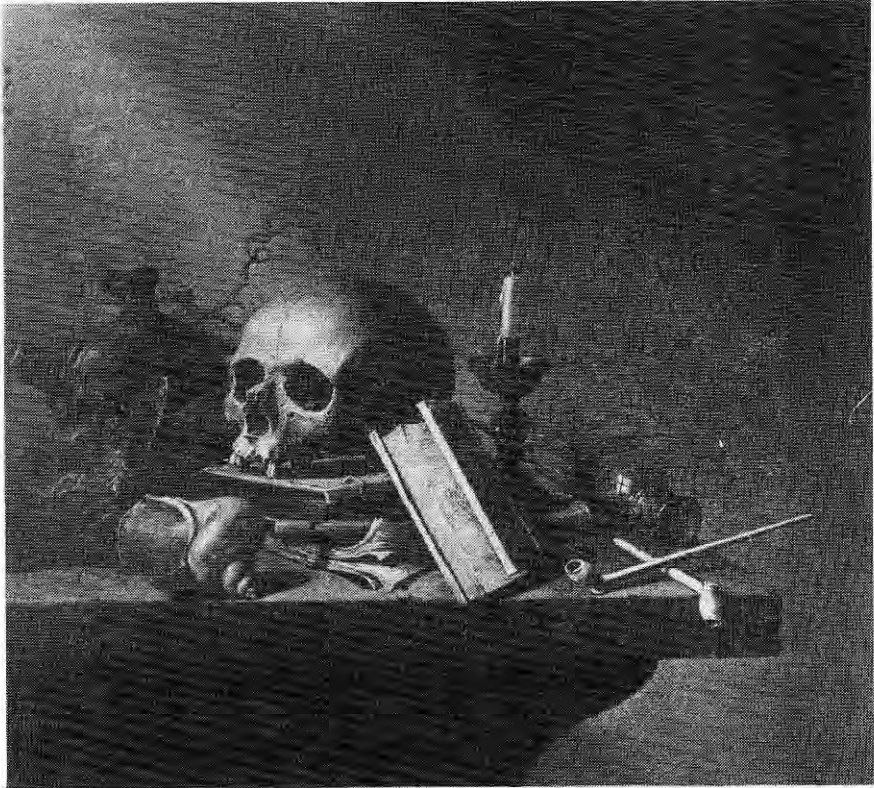
Afb.I. Vanitas , H. Steenwijck (1612-na 1656)

Voor al de stillelevens uit de periode 1620-1650 kenmerken zich door het gebruik van een dergelijk schijn-realisme. Dat betekent dat de voorwerpen waaruit deze stillelevens zijn samengesteld (schedels, boeken, uitdovende kaarsen, uurwerken en vooral ook pijpen en andere tabacologische voorwerpen) symbolisch verwijzen naar de vergankelijkheid en ijdelheid van al het aardse, als ook de zwakheid van de mens (afb.I).